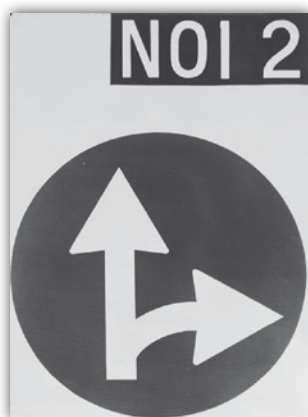
Ketty La Rocca Noi due , 1968

Fondatrice del primo Centro Studi Nazionale per la Salute e Medicina di Genere