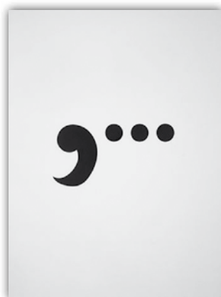
Ketty La Rocca Virgola tre punti , 1970